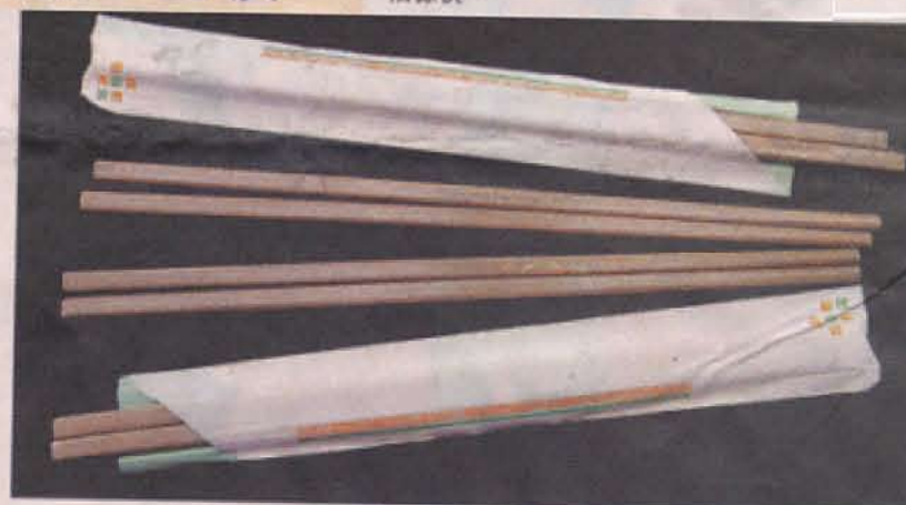
稻糠筷子经过包装后，适合随身携带或是置放在车内。